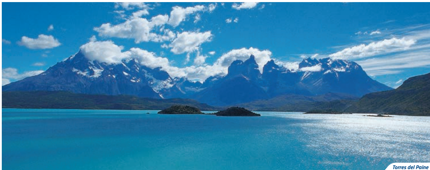
Torres del Paine