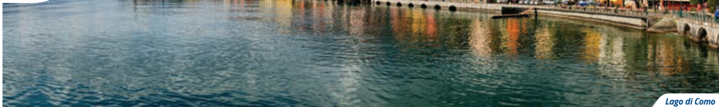
Lago di Como