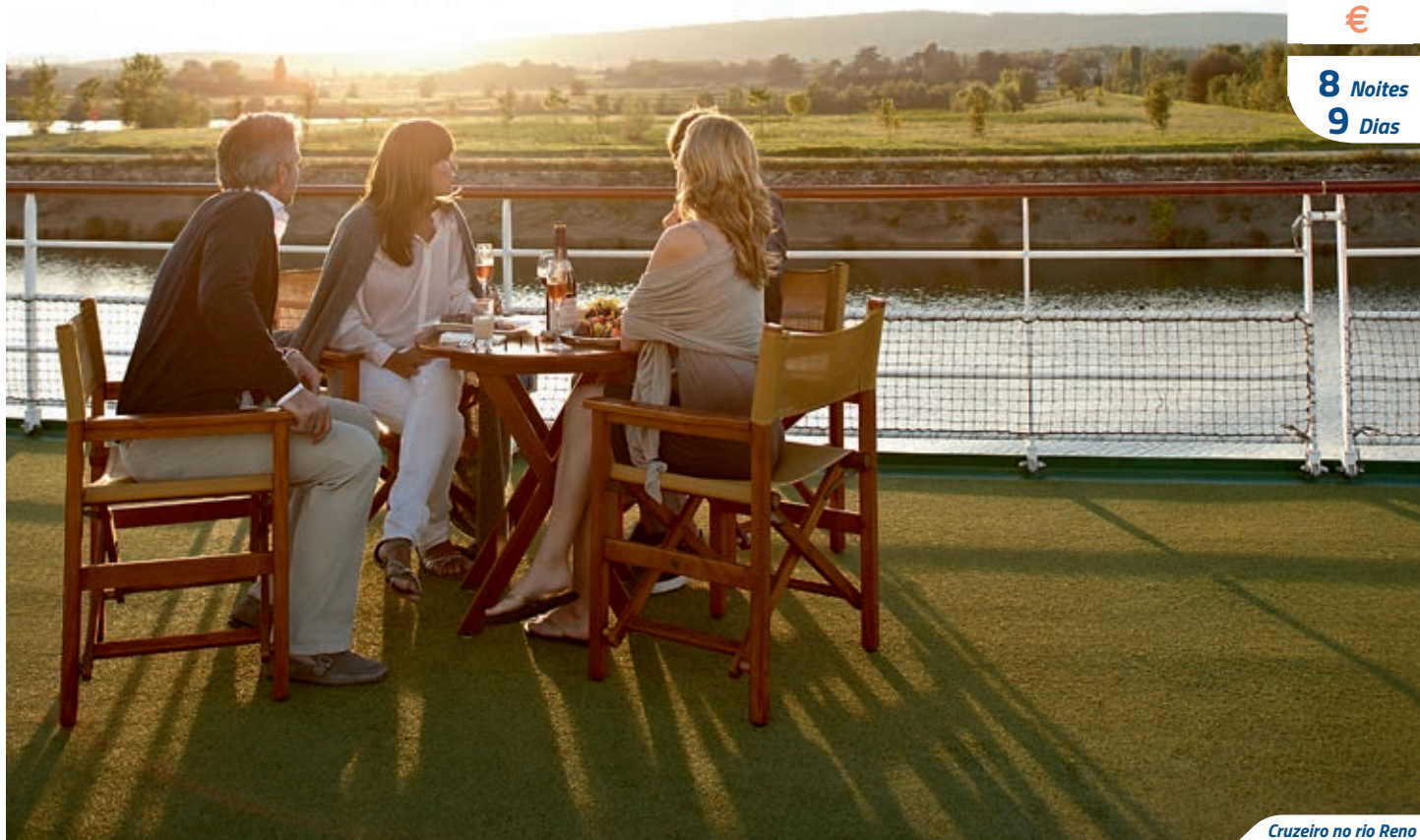
Cruzeiro no rio Reno